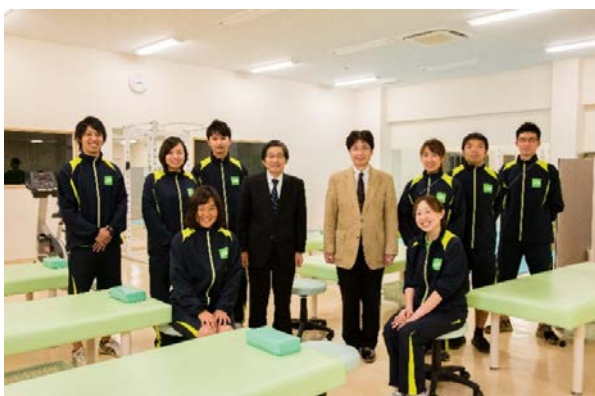
JIN整形外科リハビリスタッフ一同(リハビリテーション室にて)